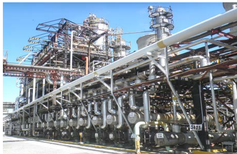
Foto: Jednotka AVD v rafinérii Litvínov.

Za provozu ostatních částí rafinérie dojde již nyní k odstavení jednotky atmosféricko-vakuové destilace ropy, hydrorafinace petroleje a druhé jednotky nafty (dieselu). Další jednotky se na zářku připravují dle nastaveného plánu.