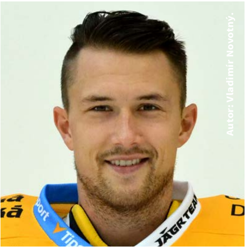
Autor: Vladimír Novotný.

Nestíhám na ně křičet, protože už jsou vpředu. (smích) Vždy je co zlepšovat v komunikaci před brankou i za brankou, když je brankář na puku. Ale v přípravě jsme mnoho gólů nedostali, a tak věřím, že nám se to povedlo dobře nastavit.